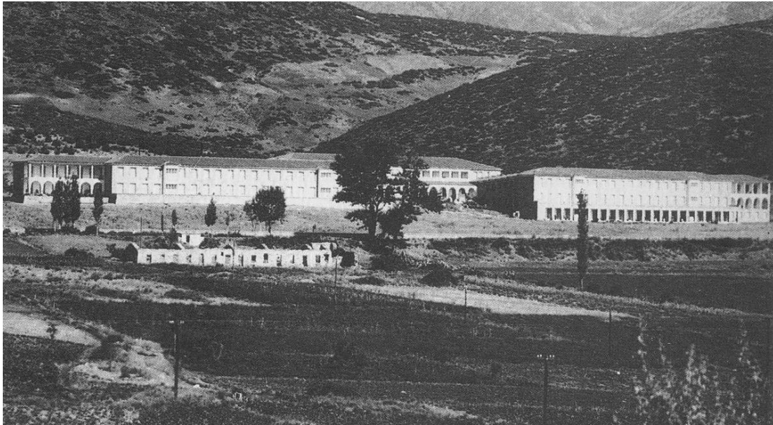
Σανατόριο Λαμίας. Αρχιτέκτων Ορέστης Μάλτος

«Η αρχιτεκτονική έκφραση των κρατικών πολιτικών για τη δημόσια υγεία και την κοινωνική πρόνοια στη μεσοπολεμική και μεταπολεμική Ελλάδα (1936-1950). Το παράδειγμα των σανατορίων του Ορέστη Μάλτου»