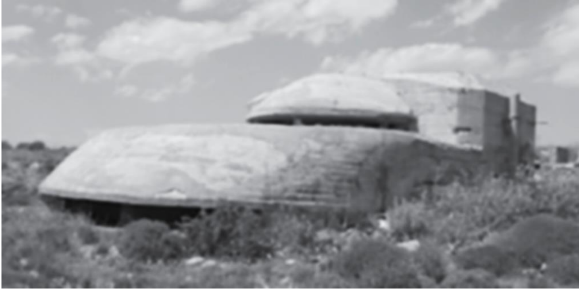
Πυροβολείο στον Τούρλο Αιγίνης