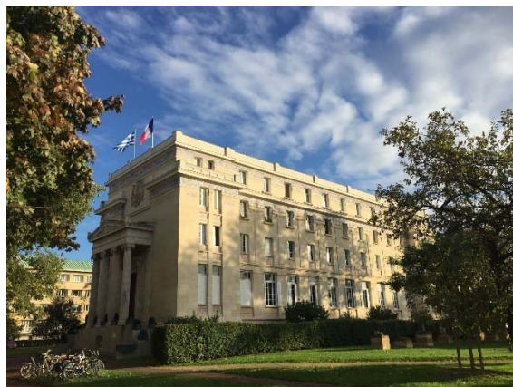
La Fondation hellénique