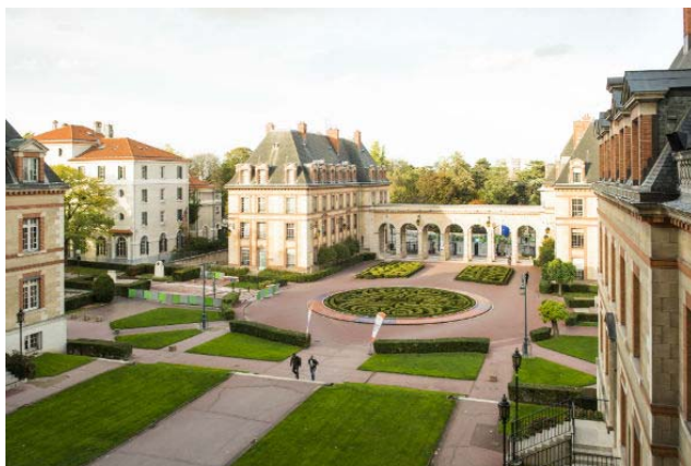
Le campus de la Cité Universitaire

Son bâtiment, œuvre de l'architecte Nicolas Zahos, construit pendant l'entre-deux-guerres combine un style néoclassique avec des références Art Déco été entièrement restauré en 2021.