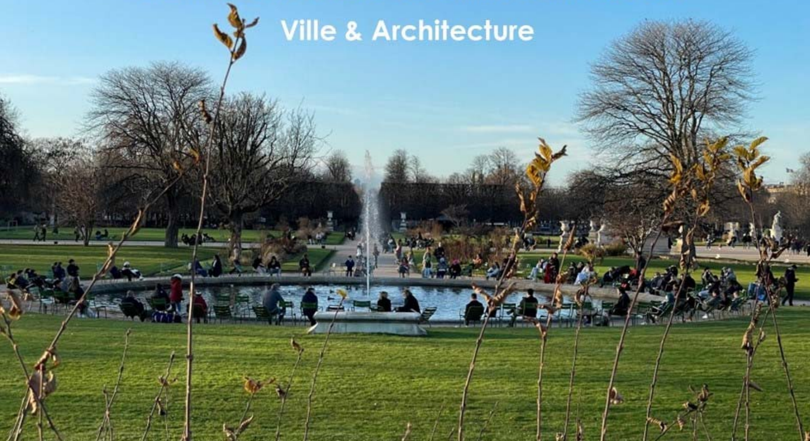
Jardin des Tuileries, Paris, Décembre 2022